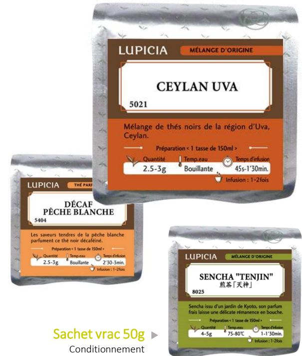
Sachet vrac 50g ► Conditionnement sous atmosphère protectrice

Le conditionnement par paquet de 50g permet de garder intact toutes les qualités des feuilles de thé comme si elles venaient d'être cueillies.