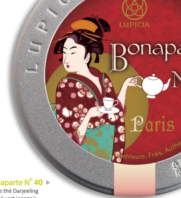
Bonaparte N° 40 ▶ Mélange de thé Darjeeling et de thé vert japonais.

2 créations originales uniquement disponibles dans la boutique parisienne sont proposées à ce jour : « Bienvenue à Paris » et « Bonaparte N°40 »