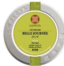
Boîte métal 50g