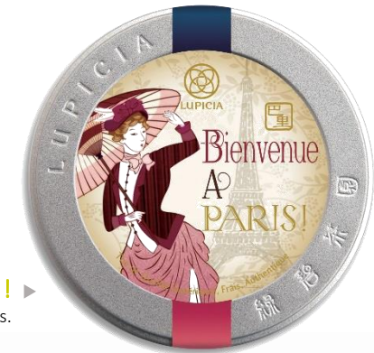
Bienvenue à paris ! ▶ Thé noir au parfum de rose et de fruits.